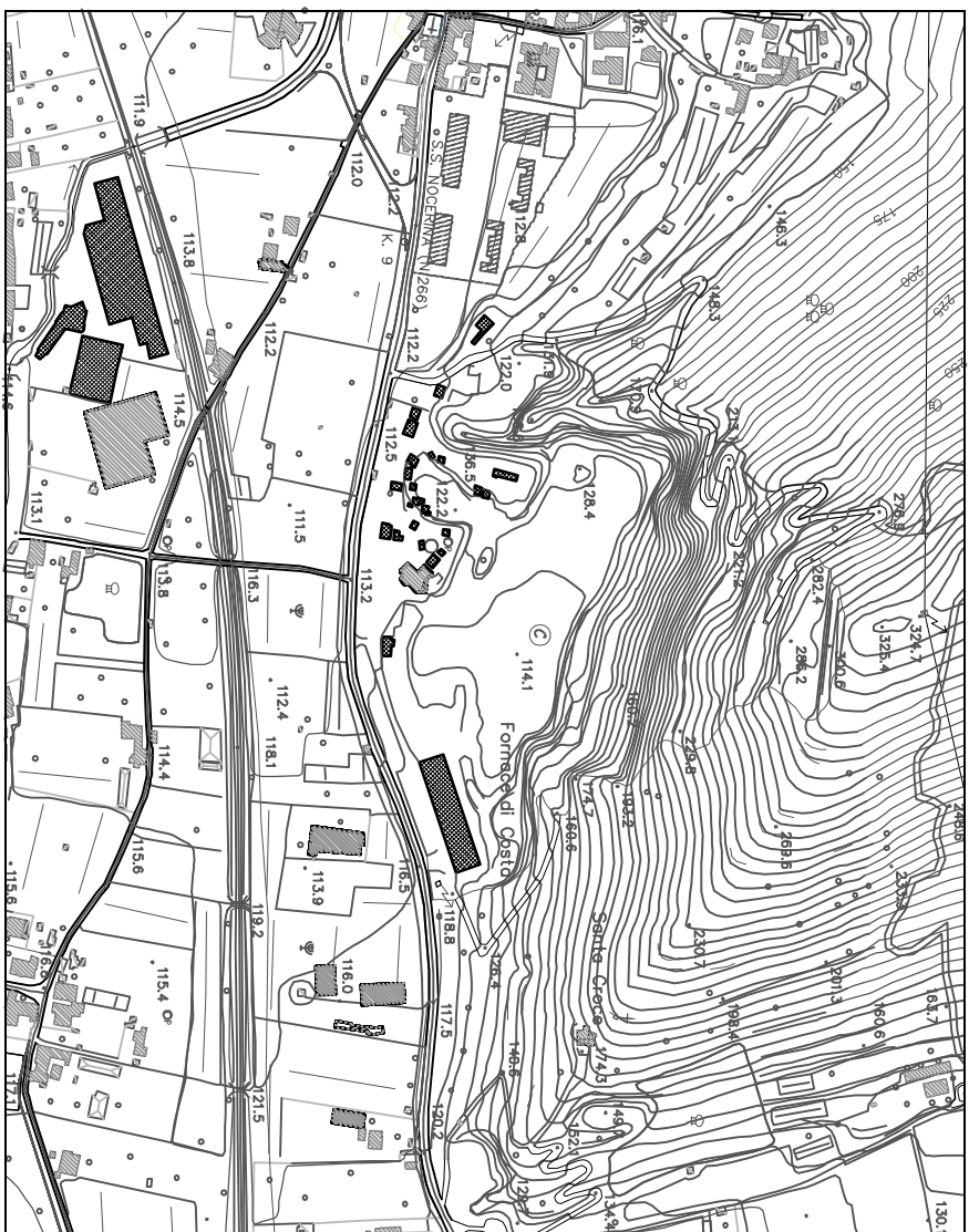
STATO DI FATTO - STRALCIO