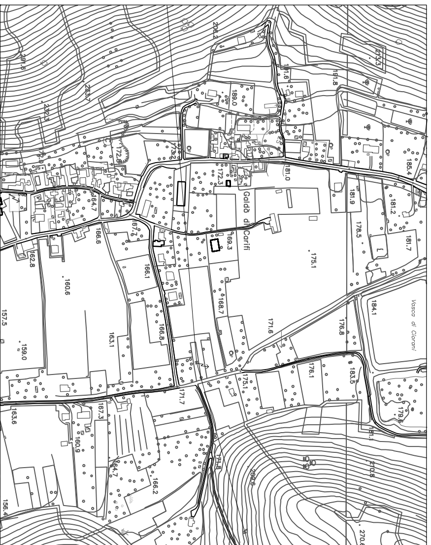
STATO DI FATTO - STRALCIO